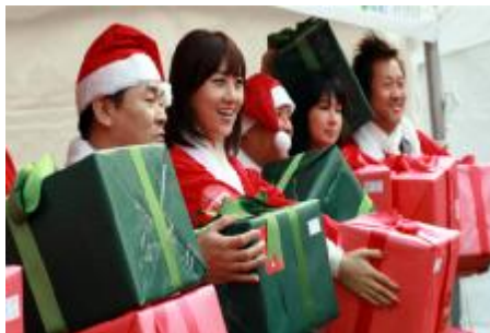
아이들의 잃어버린 소원을 찾아주는 장윤정(가수) 홍보대사 2007