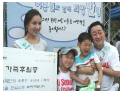
즐거움을 통한 기부문화 전파 이홍렬(개그맨) 홍보대사 1998