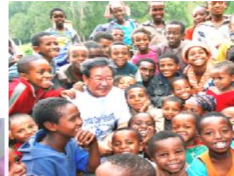
어린이재단의 오랜 후원자인 최불암(배우) 후원회장 1985