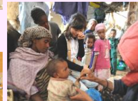
글을 통해 아이들의 삶에 생명을 불어 넣을 공지영(작가) 나눔대사 2008