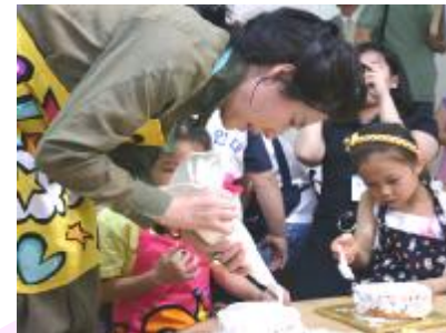
"한국의 대표적인 어머니" 고두심(배우) 나눔대사 2006